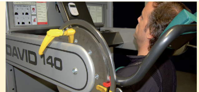
Biomechanische Funktionsanalyse der Wirbelsäule