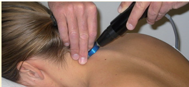
Funktionsdiagnostik mittels Spineliner®

Die Kosten für den RÜCKENCHECK - MÜNCHEN betragen ca. 850 € und werden in den meisten Fällen von den privaten Krankenkassen übernommen.