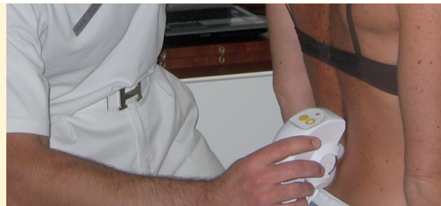
Beweglichkeitsanalyse mit der Medi-Mouse®